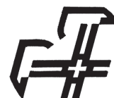
Tableau de conversion - Femmes

Directives concernant l'examen médical des sapeurs-pompiers révisée en 2013), Annexe 5.2